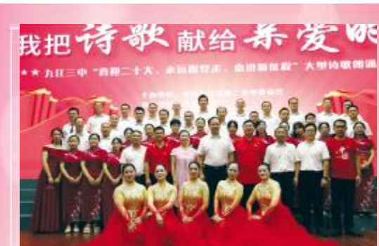
(本报讯)7月1日下午,我校“喜迎二十大 永远跟党走 奋进新征程”系列活动之“我把诗歌献给亲爱的党”大型诗歌朗诵会在体育馆隆重举行。