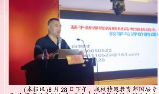
(本报讯)8月28日下午,我校特邀教育部专家、全国高考培训专家、长春市教育局教研室副主任白智才老师作了题为《基于有效测评理论下的培优培尖教学策略》讲座,400余名教师汇聚一堂,感受教育专家带来的头脑风暴。