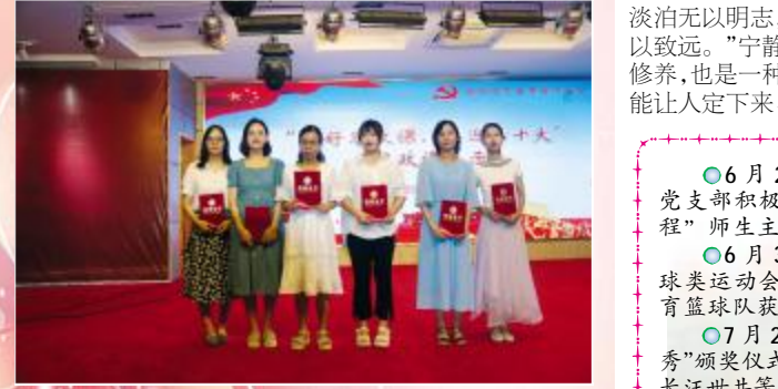
(本报讯)8月27日下午,我校在甘棠湖校区科技楼六楼多功能会议厅举办“讲好思政课,喜迎二十大”思政课展示活动。